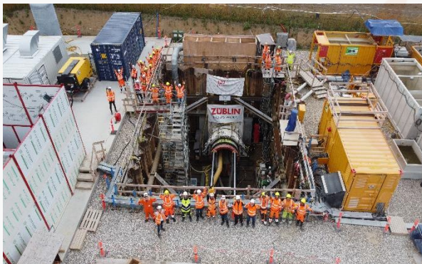
Zakończenie drążenia mikrotunelu w Danii