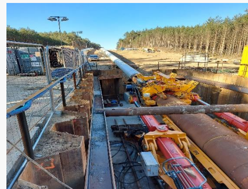
Przekroczenie bezwykopowe Direct Pipe pod rzeką Petcz (g. Goleniów – Lwówek)