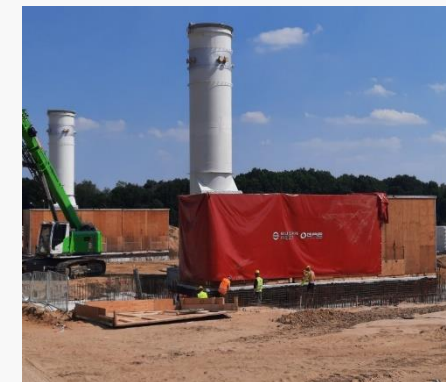
Agregaty sprężarkowe Mars z kominami (TG Goleniów)