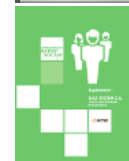
Suplementy do raportu rocznego 2013 PDF