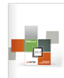
Zintegrowany raport roczny 2014 flipbook