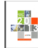
Zintegrowany raport roczny 2013 flipbook