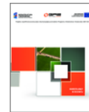
Folder „Inwestujemy w rozwój”