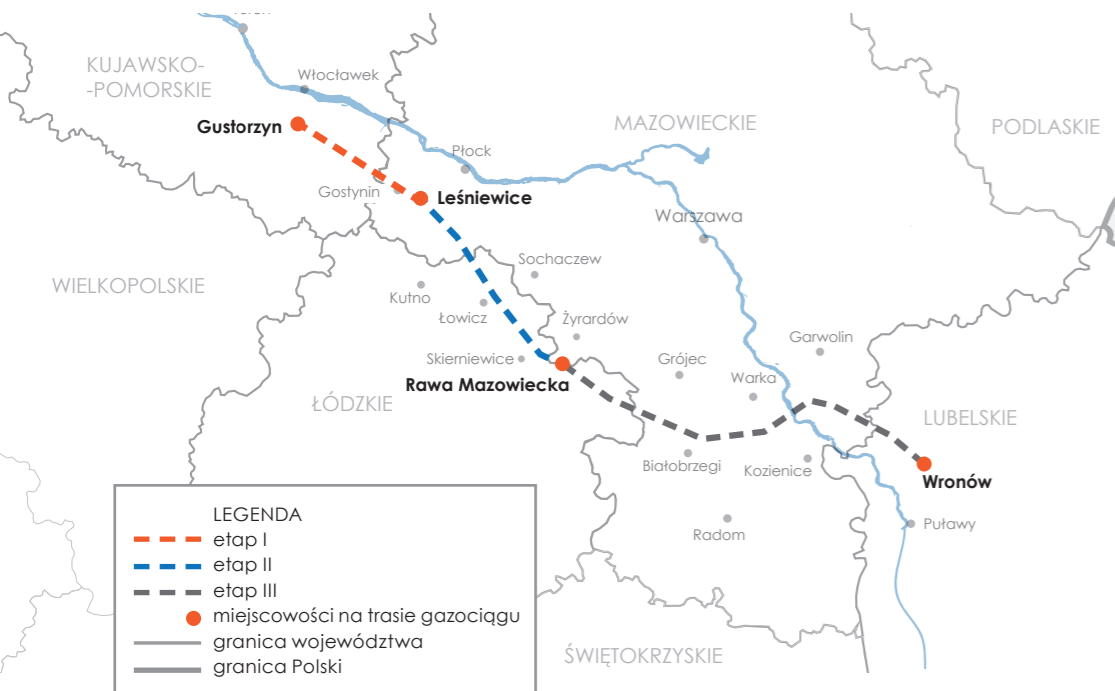
Schematyczna mapa poglądowa.